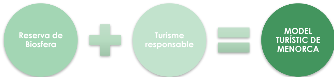
Figura 1. Principis del model turístic de Menorca

El Pla de desenvolupament turístic de Menorca 2018-2025, defineix el model turístic per l'illa com aquell que es basa en un desenvolupament turístic que vetlla per la conservació del patrimoni natural i cultural i contribueix a satisfer les necessitats socials, culturals i econòmiques dels ciutadans, promovent la investigació i la participació social (fig. 1).